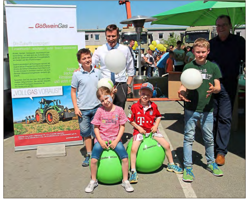
Der Renner bei Gößwein Gas waren die quietschgrünen Hüpfbälle.