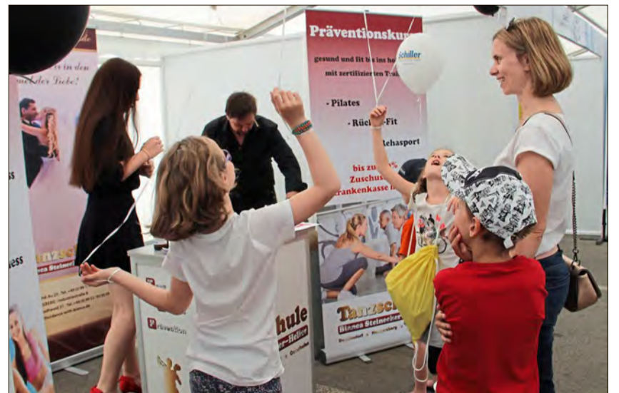
Die Tanzschule Bianca Steinecker-Heller zeigt das Angebot auf.