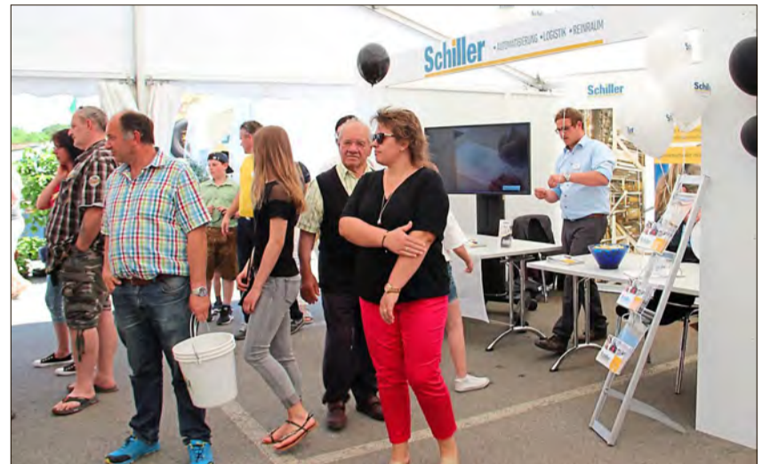
An den Ständen gab es jede Menge zu entdecken.