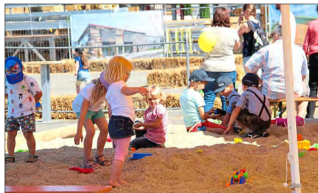
Jede Menge Spielspaß hatten die Kinder.