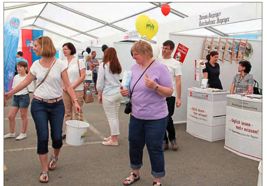
Rundgang durch die Messehalle.