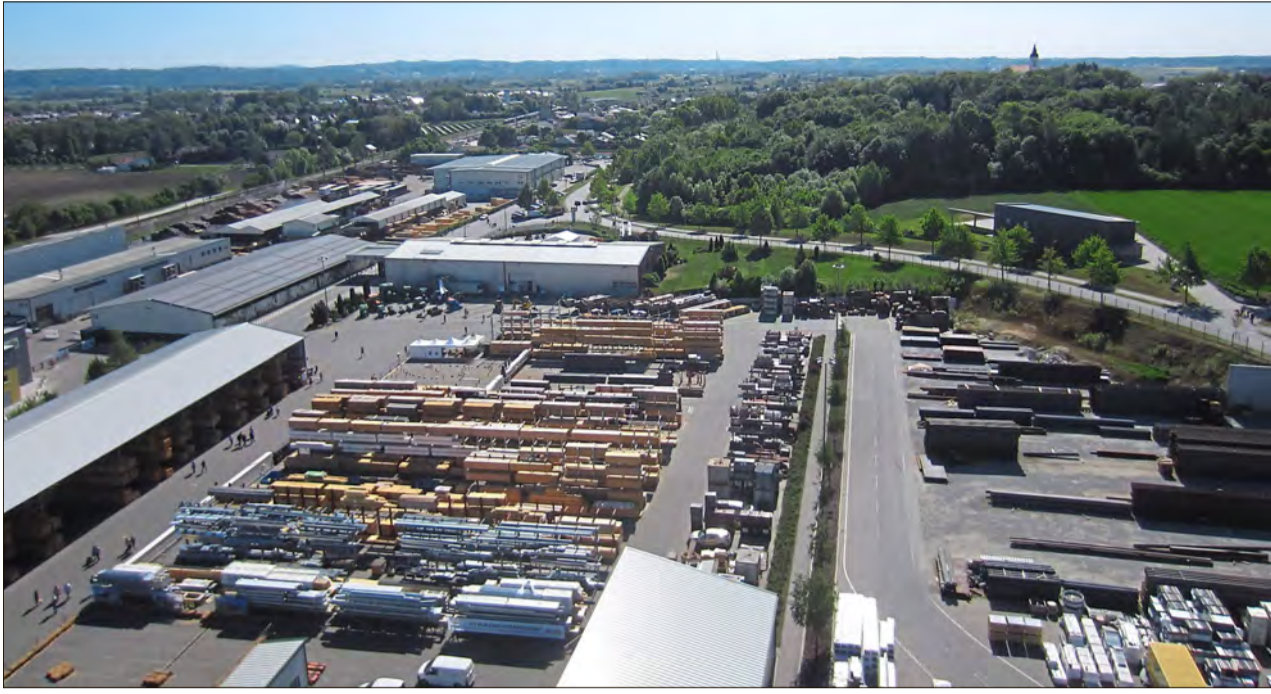
Das Wolf-Areal wurde zum Messegelände, Volksfestplatz und Ausstellungplatz.