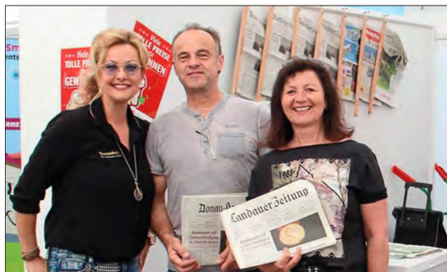
Gut belesen unterwegs.