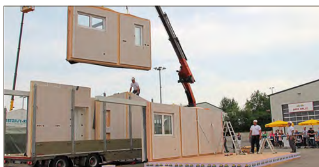
Schaumontage: So schnell steht ein Fertighaus.